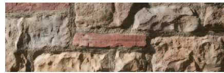
Sillarejo Munich Gris Perla Natur (GPN)