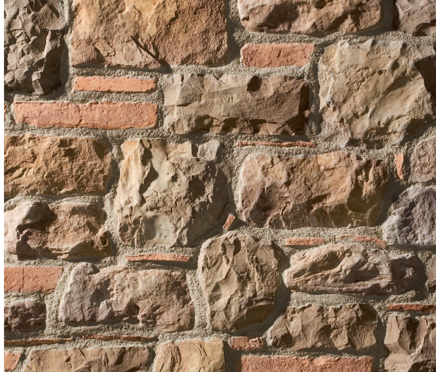
Sillarejo Munich Marrón Rojizo (MR)

e m / e max Espesor medio / máximo (cm) Average thickness / maximum (cm)