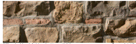
Sillarejo Munich Marrón Natur (MN)