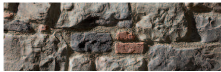
Sillarejo Munich GP + GPN