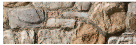
Sillarejo Munich Blanco Natur (BN)