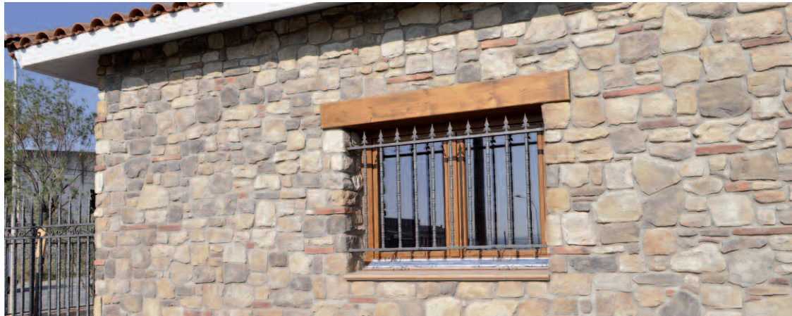
Sillarejo Munich Gris Perla