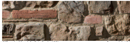
Sillarejo Munich Gris Perla (GP)