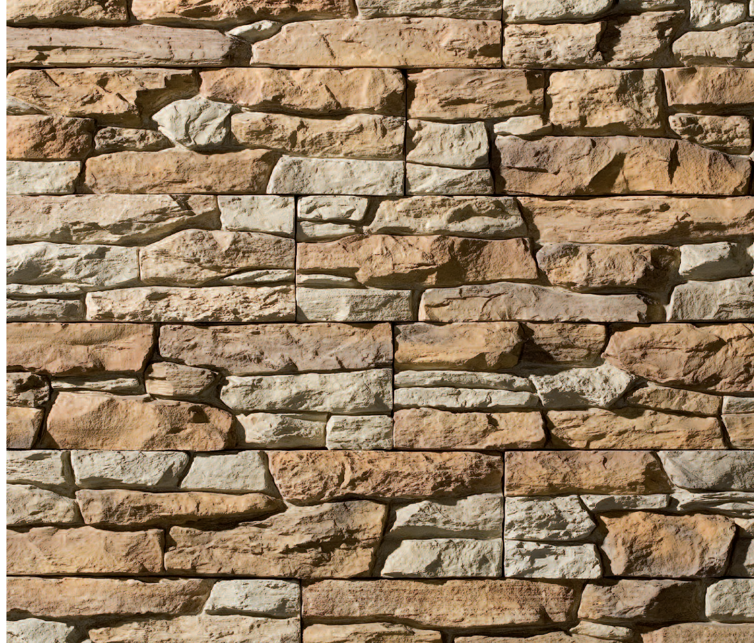
Navarra Marrón Primavera (MP)