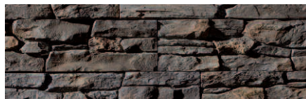
Navarra Óxido (O)