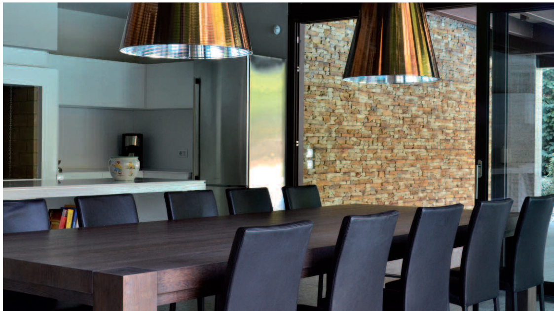
Navarra Marrón Primavera

MODELOS PANELIZADOS / PANELISED MODELS MODELES À PANNEAUX / MODELOS APANELADOS MODELLI PANNELLIZZATI / PANELMODELLE ПАНЕЛЬНЫЕ МОДЕЛИ / PANELE