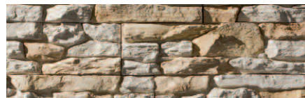
Navarra Blanco Invierno (BI)

e m / e max Espesor medio / máximo (cm) Average thickness / maximum (cm)