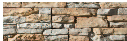
Navarra Gris Natur (GN)